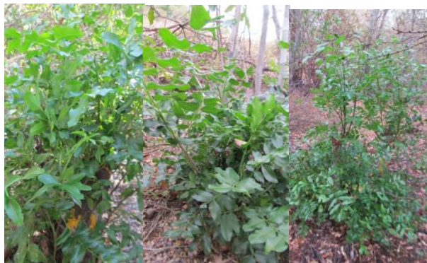
Figure 4 : Rejets secondaires après une année de coupe

La figure 4 montre la quantité d'écorces et de feuilles que peuvent fournir les rejets de C. grevei dit Katrafay Filo et Katrafay Dobo de diamètre moyen inférieur à 3 cm et de hauteurs respectives de 2.1 m et 2.7 m. On constate que la production en écorce est proportionnelle à la