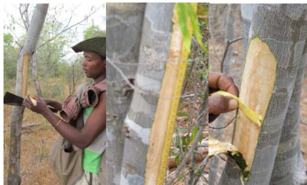
Figure 1 : Ecorçage de différentes bandelettes

Des rejets de souche ont été aussi traités. Des rejets primaires de souches sont de nouveau coupés et écorçés complètement. Les rejets secondaires apparus après une année de coupe sont évalués en nombre et en taille ainsi que l'état de recouvrement en écorce des surfaces écorçées pour les arbres étudiés.